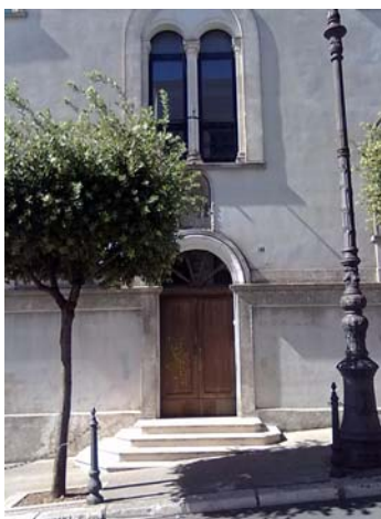
L'ingresso dell'edificio scolastico "G.B. Perasso"

Ci siamo trovati molto bene; i professori in un primo momento ci sono sembrati severi, nei giorni successivi si sono rivelati molto simpatici. La prima settimana ci hanno accolto molto bene, con giochi,