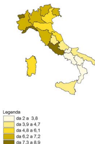
Figura 2 - Tassi di separazione per regione. Anno 2003 (per 1.000 coppie coniugate)