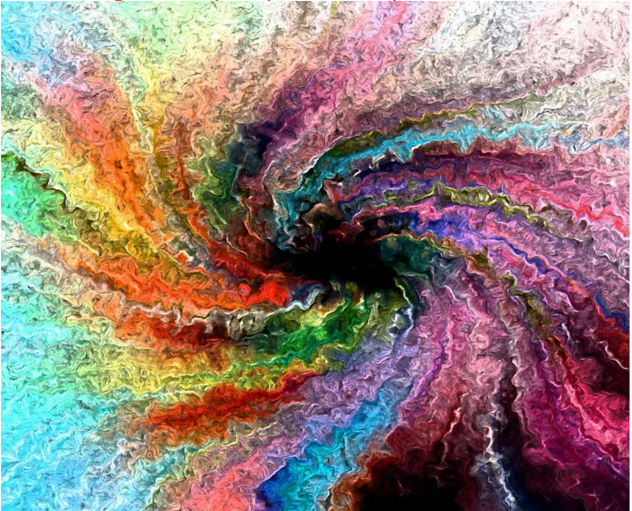
Imagination as a tornado of colours

<< La immaginazione è più importante del sapere. "Albert Einstein" >>>