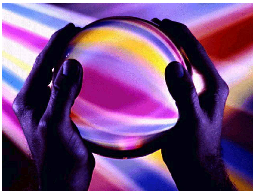
LOOKING FOR A MORE CONSCIOUS FUTURE

Legenda: (P= Photon; E = Entanglement ; D = Dimension ; OB =Occipital Lobe ; M M = Memory)