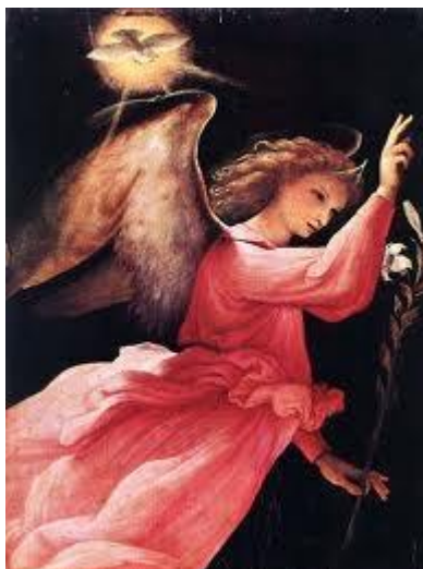
Lorenzo Lotto ( Venezia, 1480 ) (Angel)