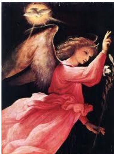
Lorenzo Lotto ( Venezia, 1480 ) (Angel)

Le nuove tecnologie di illuminazione a LED migliorano la percezione visiva delle opere d'arte come è stato sperimentato dai Lighting Designer, Francesco Iannone e Serena Tellini, utilizzando delle lampade LED con emissione sul rosso e sul blu alla mostra di Lorenzo Lotto presso le Scuderie del Quirinale.