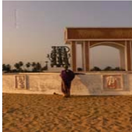
La porta del non Ritorno: Ouidah-Benin

La “INDICAMETRIE” e' la scienza delle scienze dello sviluppo globale, modulato sullo sviluppo qualitativo del capitale umano, in modo tale da riposizionare gli indicatori oggettivi della economia classica, sulla base di indicatori soggettivi e culturali del benessere e della naturale felicità dell' uomo .