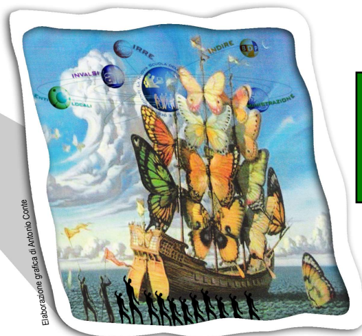
Elaborazione grafica di Antonio Conte