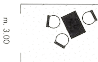
stand di corridoio